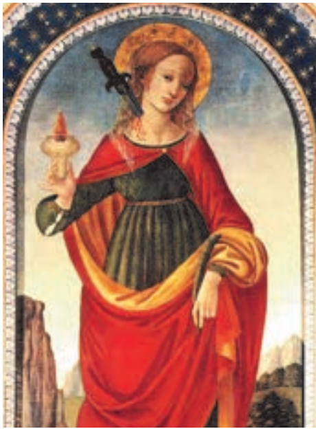
Filippino Lippi, Święta Lucja (fragm.)

wieku mówi, że udała się do grobu św. Agaty, aby za jej pośrednictwem uprosić zdrowie dla swej chorej matki. Otrzymała nie tylko dar, o który prosiła, ale zapewnienie, że sama dostąpi chwały męczeństwa.