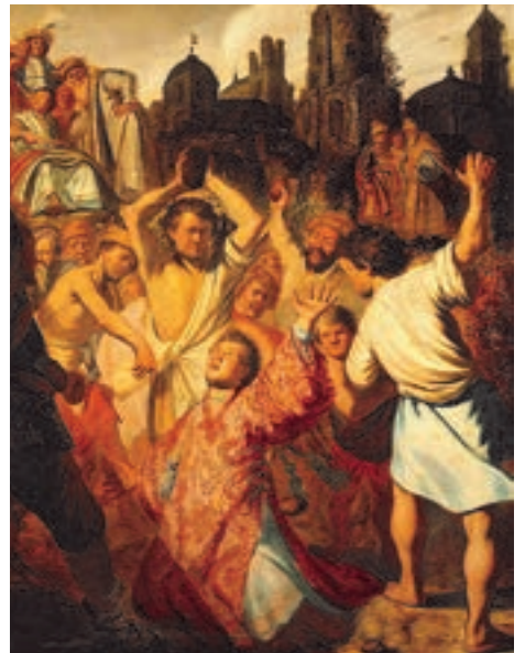
Rembrandt Ukamenowanie św. Szczepana (fragm.)

Przykładem niezłomnej wiary jest św. Szczepan, który wspomniany jest 26 grudnia .