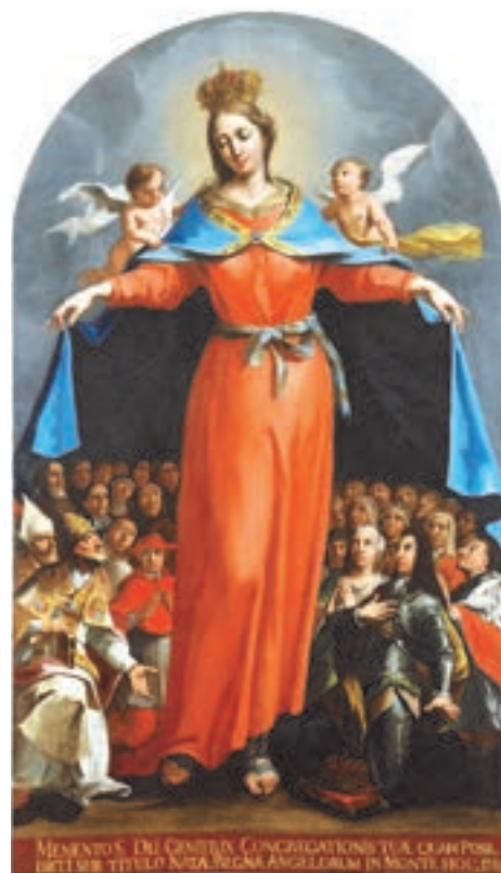
Wikimedia (Domena Publiczna) Valentin Metzinger – Wspomożycielka Wiernych

Rola Maryi, jako Matki Kościoła, nie kończy się w czasach apostołskich. Trwa także dziś. Macie-