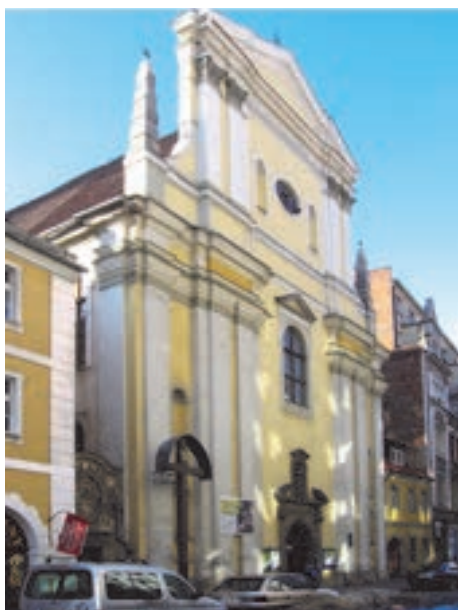
Kościół św. Antoniego Padewskiego we Wrocławiu

Po wojnie opiekę nad kościołem przejęli księża Salezjanie. Świątynia stała się wtedy kościołem parafii św. Mikołaja, która otrzymała go po tym, jak w wyniku działań wojennych straciła świątynię parafialną wznoszącą się niegdyś przy placu św. Mikołaja. Salezjanie propago-