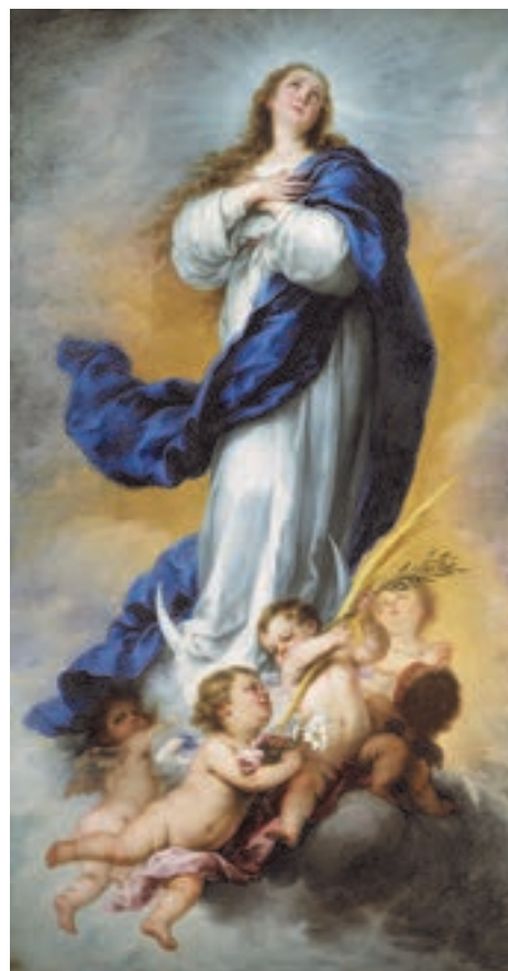
Bartolomé Esteban Murillo Niepokalane Poczęcie

4 grudnia wspominana jest św. Barbary, która żyła na przełomie III i IV w. Kiedy przyjęła chrzest, złożyła przysięgę, że dla Jezusa będzie żyć w czystości do śmierci. Spotkało się to z ostrą reakcją jej ojca, który chciał zmusić ją do odstępowania od wiary, złorzeczył, bił, a nawet groził śmiercią. Gdy to nie odniosło skutku zadencjonował ją władzom. Po ciężkich torturach zginęła z rąk własnego ojca, który ściął jej głowę. Było to w czasie panowania cesarza Maksymiana Galeriusza (305-311), kiedy nasilenie prześladowań za było najkrwawsze.