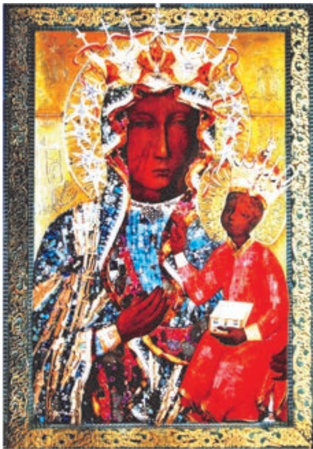
Obraz Matki Boskiej Częstochowskiej w sukience wdzięczności i z koronami narodu polskiego