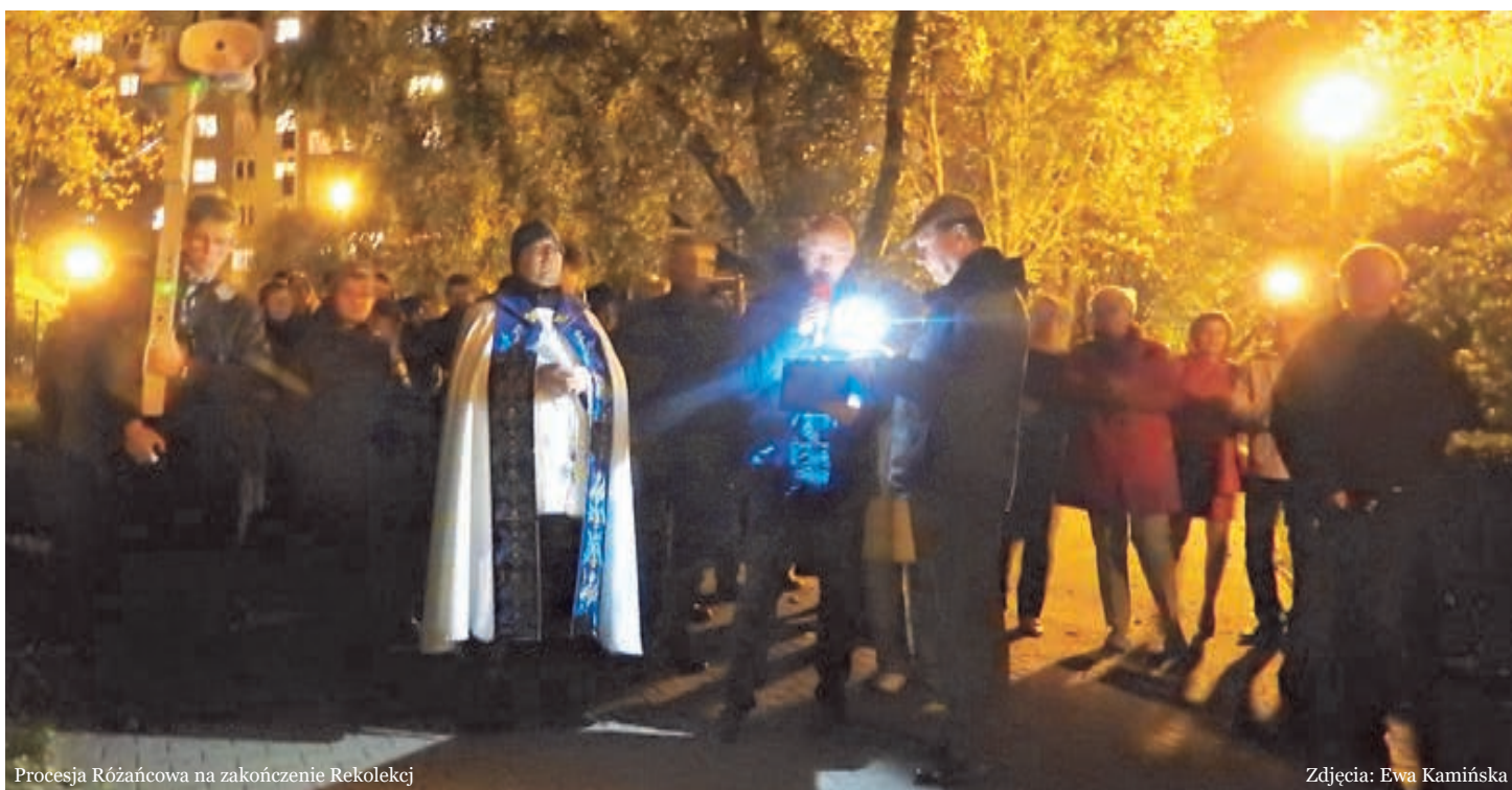
Procesja Różańcowa na zakończenie Rekolekcji

mniany Żywy Różaniec, [...] Nieustająca Różaniec, inicjatywa, która jest zaproszeniem, aby nie odmawiać Różaniec w ważnych sprawach i wydarzeń w Polsce. [...] Słyszeliśmy pewnie o Różańcu Rodziców za Dzieci, bo rodzice mają świadomość, że nie wszystko są w stanie zrobić, ochronić dziecka przed każdym niewłaściwym krokiem wobec niego i dziecka wobec innych. Znany jest Różaniec Małżeński, bo małżonkowie także potrzebują wspierać siebie nawzajem. Pewnie słyszeliście o Różańcu Mężczyzn. Robi na mnie wielkie wrażenie, kiedy dziesiątki mężczyzn publicznie kłękają odmawiają Różaniec. [...] Są bractwa różańcowe. Nawet w jednej z parafii naszego miasta jest Bractwo różańcowe, które modli się o dobre wychowanie młodego pokolenia. Są grupy, które posługują się modlitwą różańcową m.in. Ruch Światło Życie. [...] Każdy ma propozycję, aby różaniec był osobistym narzędziem, po które można sięgać, można mieć w kieszeni czy torebce, na palcu, a może zawieszony na szyi, nie dla ozdoby, ale po to żeby w różnych momentach swojego życia, także ciężkich, sięgać po niego. Może warto zrobić krok i włączyć się do jakiejś ze wspomnianych grup, poświęcić 3-5 minut dziennie na modlitwę. To tak dużo, ale i tak niedużo. [...] To także dar dla sprawy Kościoła, w intencjach, jakie podpowiada papież. Możemy podjąć tę walkę, możemy. Na pewno jest to dobry czas, aby to uczynić i tego życzyć. Amen.