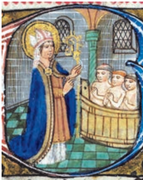
Inićiał z XIV-wiecznej angielskiej księdze godzin, Święty Mikołaj wskrzeszający zamordowane dzieci