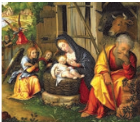
Lorenzo Leonbruno da Mantova Boże Narodzenie (fragm.)

25 grudnia – Boże Narodzenie. Ta noc zmieniła bieg dziejów ludzkich. Historia zbawienia spłótła się z historią ludzi. Maryja „powiła swego pierworodnego Syna, owinęła Go w pieluszki i położyła w żłobie,