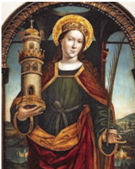
Nieznany malarz portugalski Święta Barbara (fragm.)