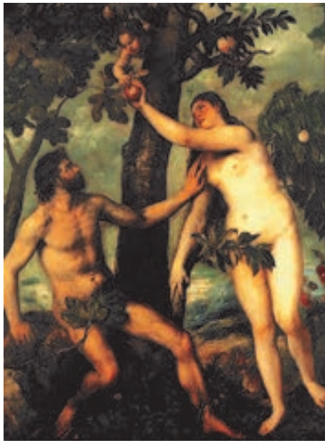
Tycjan, Adam i Ewa

Ewa, to pierwsza kobieta, pramatka, małżonka Adama. Jej imię znaczy matka. Opis jej stworzenia z żebra Adama podkreśla tożsamość człowieczeństwa kobiety i mężczyzny. Zwiędzona przez szatana popełniła grzech, powodując nieszczęście duchowe i egzystencjalne. Grzech i kara nie przekreśliły zawartego w błogosławieństwie Bożym daru przekazywania życia, choć sprowadziły cierpienia i trudy. Ewa jest figurą Maryi, przez którą przyszło na świat zbawienie.