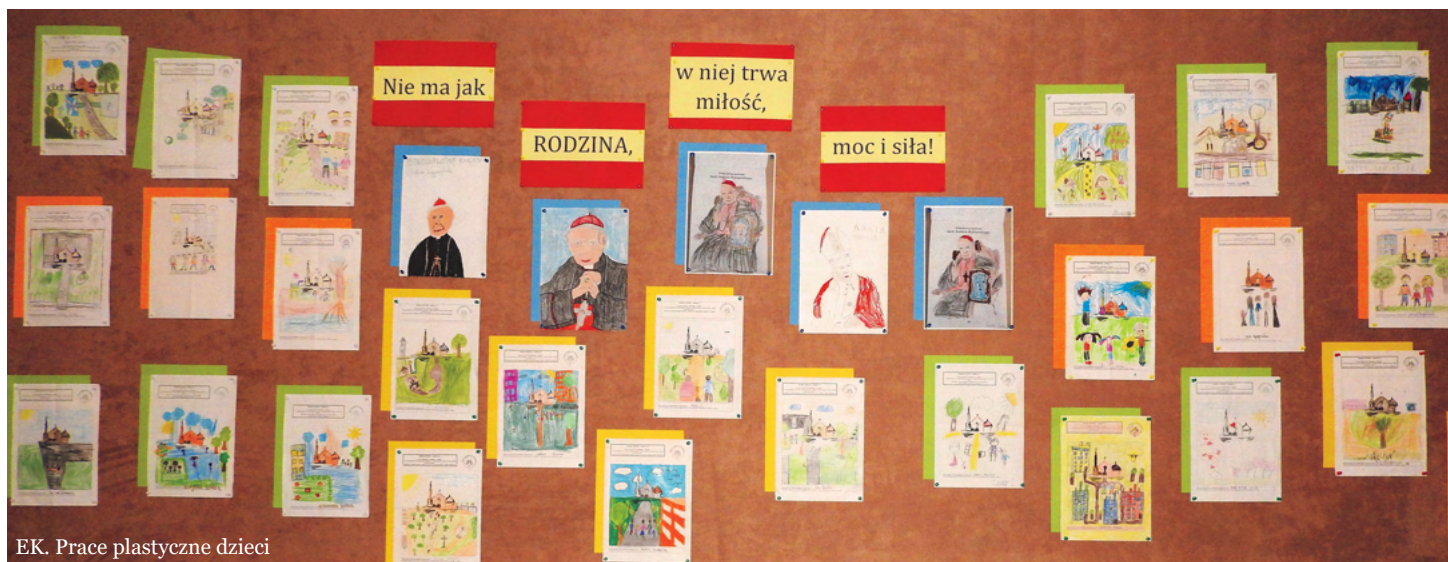
EK. Prace plastyczne dzieci

Dajmy się zatem poprowadzić temu Duchowi. Wierzę, że możemy uczynić kroki, które zbliżą do siebie małżonków, rodziców, dziadków, babcie, rodzeństwo. Niech ten szczególny znak Boga będzie odnawiany w małżeństwach i rodzinach naszej parafii. Amen.