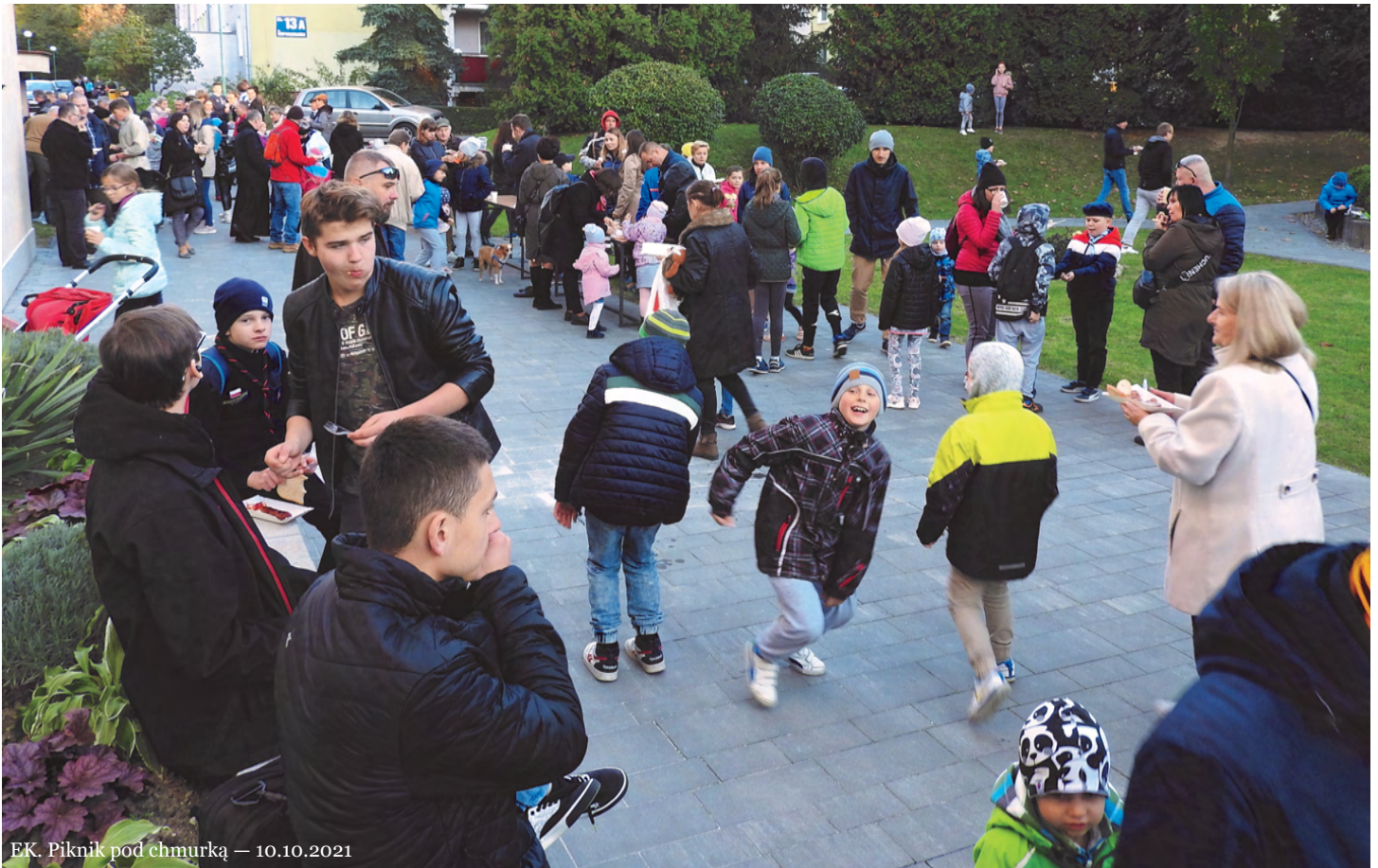
EK. Piknik pod chmurką — 10.10.2021

Porównałbym to do sytuacji, kiedy np. idziemy do lekarza specjalisty. Zanim lekarz zacznie głębiej drążyć temat, który dotyczy jego konkretnej specjalności, najpierw [...] przejdzie przez taki pakiet podstawowy – co boli, jakie jest samopoczucie, czy jest gorączka, teraz dojdzie pewnie pytanie o test na koronawirusa. [...] Młodzieniec, jak się okazało, wszystkich przykazań Bożych przestrzegał, [...] ale kiedy doszedł temat dóbr materialnych, zmartwił się i odszedł zasmucony. Może na inną odpowiedź liczył? Może był przywiązany do tego, co miał, może zdał so-