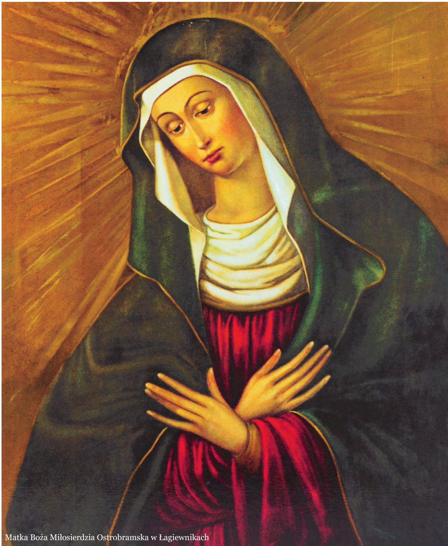
Matka Boża Miłosierdzia Ostrobramska w Łagiewnikach

Dzięki Tobie składam Matko Boska za wysłuchanie próśb moich, a proszę Cię, Matko Miłosierdzia, zachowaj mnie nadal w łasce i opiece Swojej Przenajświętszej.