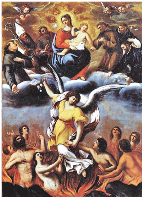
Annibale Carracci – Czyściciel (XVI w.)

Św. Faustyna pisząc o wizji piekła, którą dane było jej doświadczyć, obok słów świadczących o doznanym wstrzą-