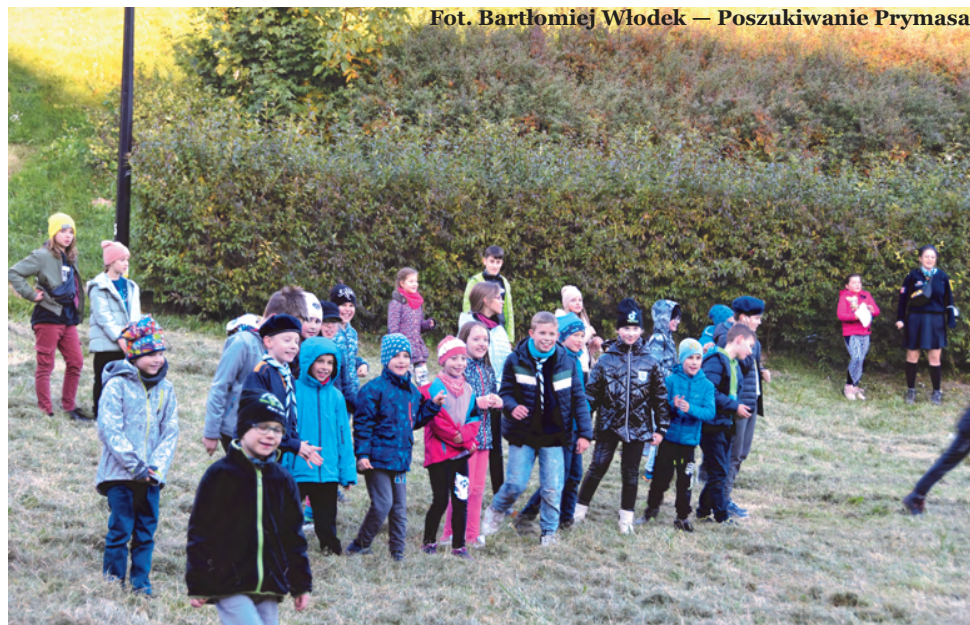
Poszukiwanie Prymasa